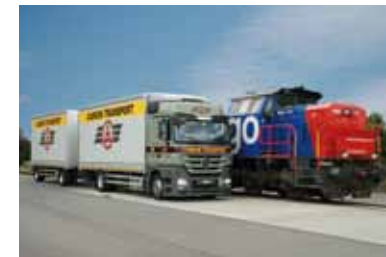
Con il sistema duale di trasporto della CAMION TRASPORT viaggiate su strade sicure.