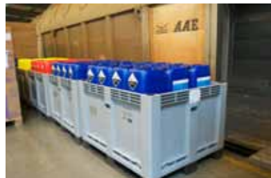
Merchi pericolose imballate in modo sicuro per il trasporto e pronte per essere caricate.